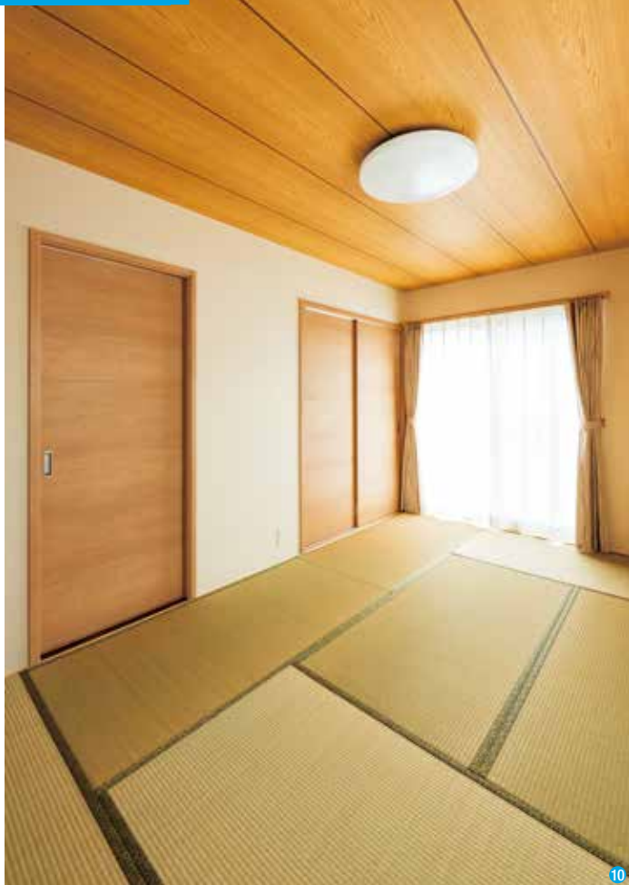
和に憧れがあったご主人も納得の和室。建具には木調の室内建材を使用。襖と違って色あせや張替などの心配がなく、耐久性もあるのでメンテナンスも楽

サッシや収納のドアなどは、これらを取り扱う親会社のスケールメリットで大幅にコストダウン。同じ予算で、設備のランクアップや窓を増やすことなどができる。