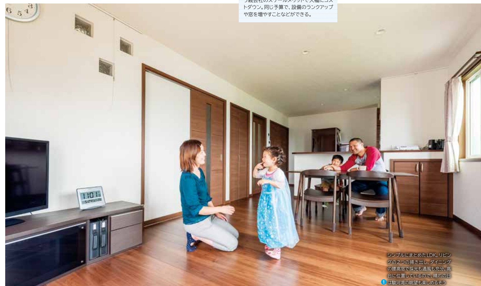
シンプルにまとめたLDK。リビングの2つの掃き出し、ダイニングの腰高窓で採光も通風も充分。高台に位置しているため、晴れの日は駿河湾の眺望も楽しめるそう