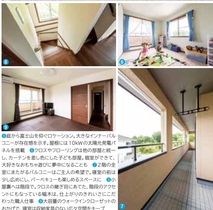
⑤庭から富士山を仰ぐロケーション。大きなインナーバルコニーが存在感を示す。屋根には10kWの太陽光発電パネルを搭載 ⑥クロスやフローリングは他の部屋と統一し、カーテンを差し色にした子ども部屋。個室ができて、好きなおもちゃ遊びに夢中になることも ⑦2階の全室にまたがるバルコニーはご主人の希望で。寝室の前は少し広めにし、バーベキューも楽しめるスペースに ⑧小屋裏へは階段で。クロスの継ぎ目にあてた、階段のアクセントにもなっている幅木は、仕上がりのきれいにこだわった職人仕事 ⑨大容量のウォークインクローゼットのおかげで、寝室は収納家具のない広々空間をキープ