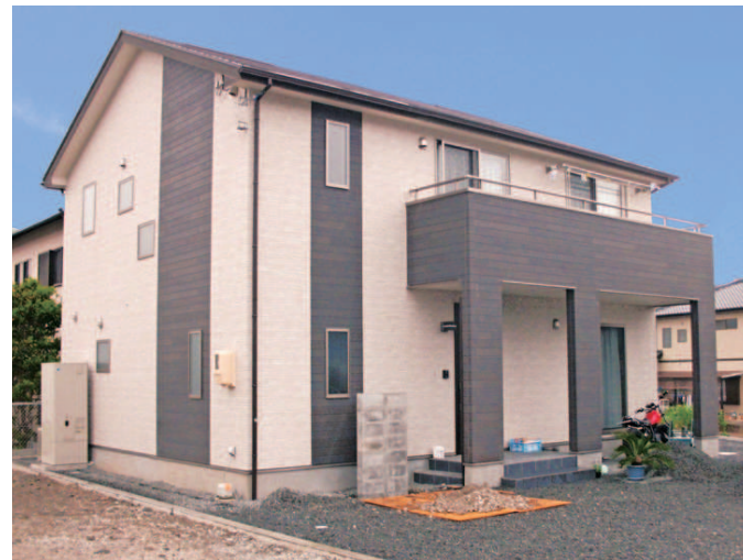
存在感のあるバルコニーや効果的に配したツートンカラーが目を引く外観

わがまま満載のフリープランと無理のない支払いで理想の家を 「憧れのマイホーム、でも土地探しだけでは資金も不安」という、若い世代の家づくりもしっかりサポートしてくれる。「収納スペースはたっぷり」「カウンターキッチンはシックなバーの雰囲気」など、こだわりの形にする『ハウテックス』 の家づくり。フリープランなのに、なんと1,000万円台から実現可能。追加料金も一つひとつ明確にしながら打合せを進めてくれるから安心。女性営業ならではの視点が活きた、細やかな提案も好評だ。