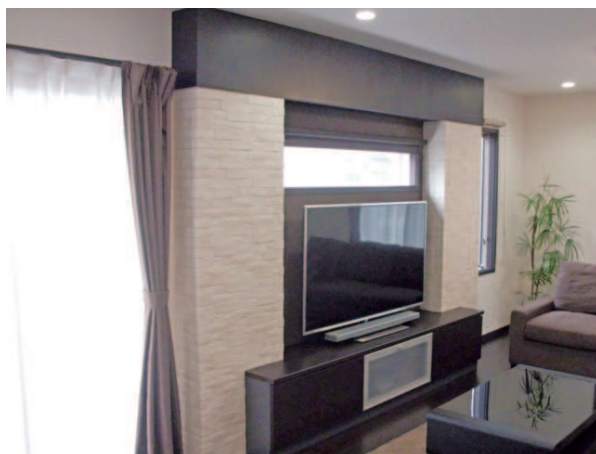
施主さんがこだわった一枚板を使ったカウンターは、レンガ調のクロスでバーの雰囲気に。リゾートホテルの客室のようなTVボードなど、コストを抑えながらも洗練されたデザインも人気の理由